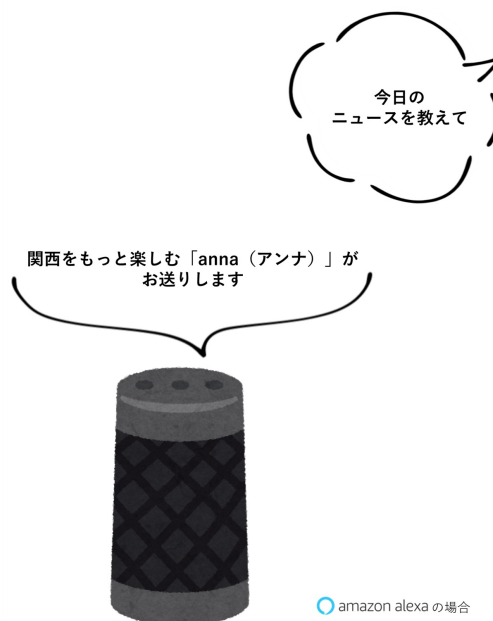
amazon alexa の場合

3. 関西のイベントやトレンド情報が再生されます。 ※Podcastの場合は「購読」すると以降、最新の記事が配信され再生が可能